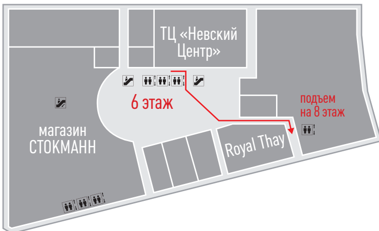
Схема 3А. Проход через ТЦ «Невский Центр» с паркинга в «Немецкую клинику»

С подземного паркинга Вы можете: 1. на центральном лифте подняться на 1 этаж ТЦ "Невский Центр", выйти на улицу через Н&М, далее следовать согласно схеме 1. 2. на центральном лифте подняться на 6 этаж ТЦ "Невский Центр" и следовать согласно схеме 3А. Внимание: боковой лифт едет только до 5 этажа магазина "Стокманн"