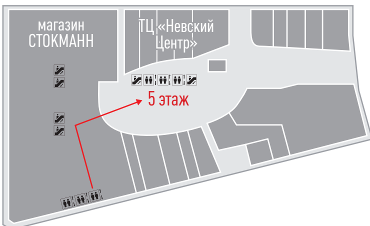
Схема 3В. Проход через магазин Стокманн с паркинга в «Немецкую клинику»

Поднявшись на 6 этаж на лифте, поверните направо и пройдите по стеклянному мосту до эвакуационного лифта около Royal Thai, откройте дверь и пройдите по коридору до лифта. На лифте поднимитесь на 8 этаж. !Дверь открыта только по направлению в клинику. Обратно - обратитесь к администратору.